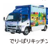
でりばりキッチン 阿波ふうど号