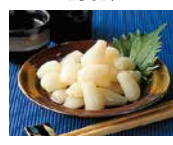
らっきょうの酢漬け