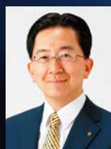
達増拓也 (岩手県知事)