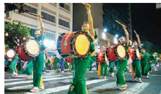
●岩手県 「赤坂さんさ」