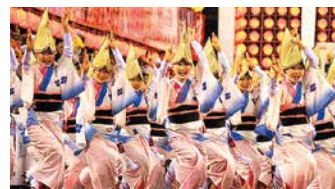
●徳島県「阿波おどり」