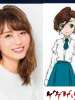
藤井ゆきよ (犬山まな役)