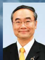
飯泉嘉門 (徳島県知事)