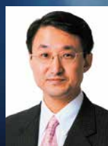
平井伸治 (鳥取県知事)