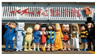
●鳥取県「ゲゲゲの鬼太郎と仲間たち」 ©水木プロダクション